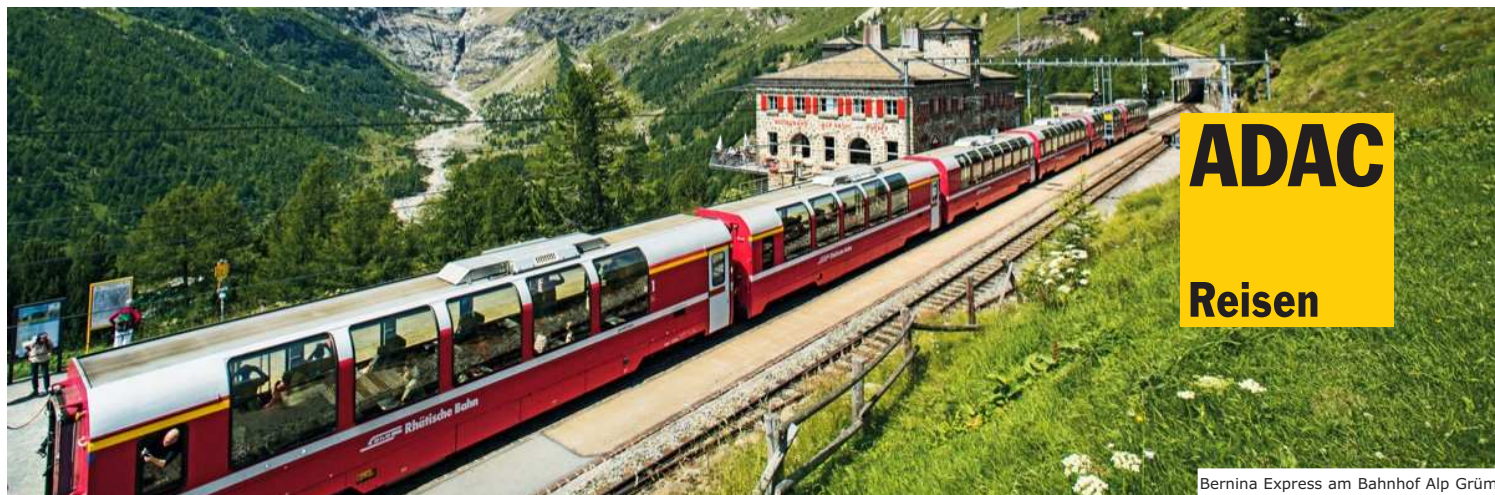
Bernina Express am Bahnhof Alp Grüm